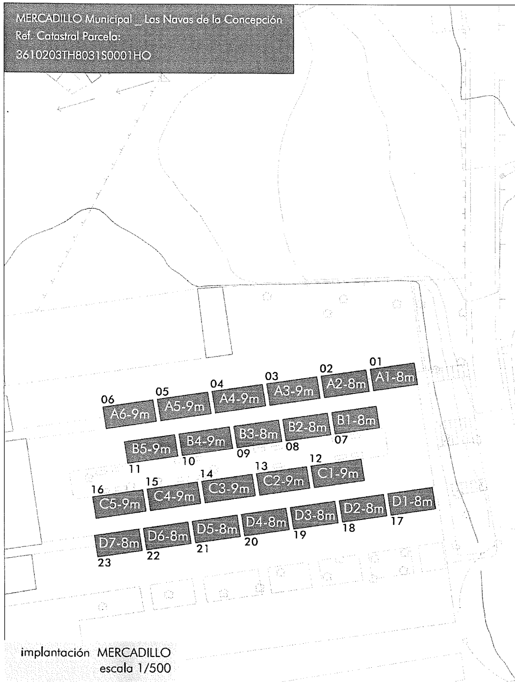
ANEXO III _ PLANO MERCADILLO MUNICIPAL _ Las Navas de la Concepción (Sevilla) implantación _ 02